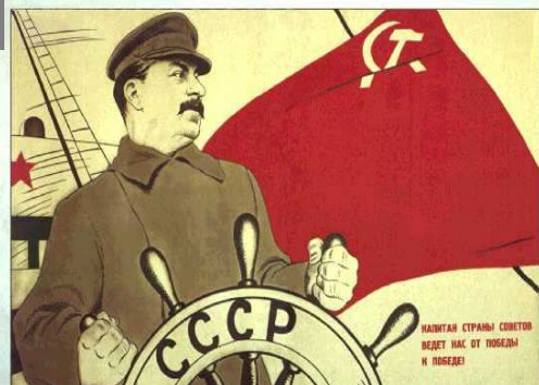
Cartel de Propaganda Soviético. 1938. 24x36 cm.